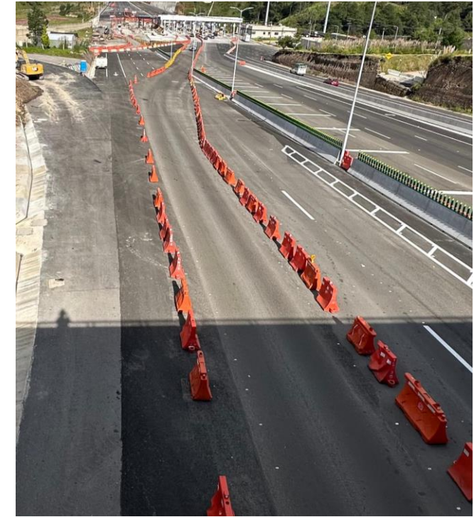
PLANO DE SENALAMIENTO DE PROTECCIÓN DE OBRA PARA EL CONFINAMIENTO DE UN CARRIL Y ACOTAMIENTO DE LA AUTOPISTA TOLUCA-ZITÁCUARO PARA CONSTRUCCIÓN DE FILTRO EN EL KM 105+800